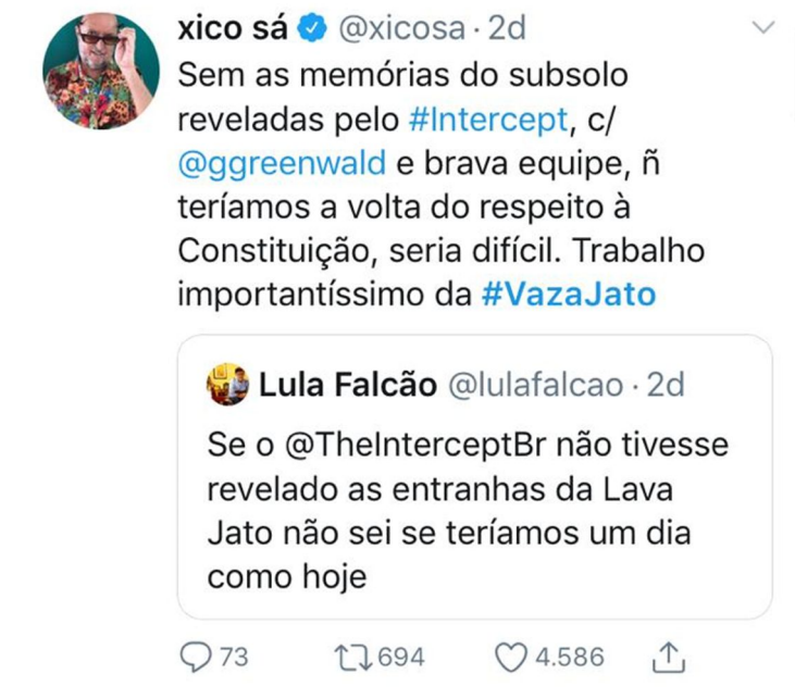
Figura 3 - Sequência Discursiva 3